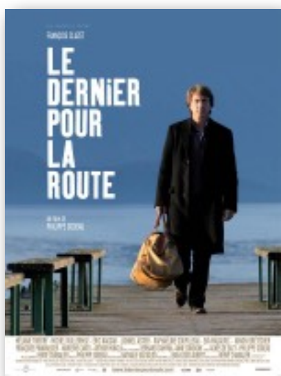
Le dernier pour la route

Un film de Philippe Godeau Septembre 2009 Durée : 1h47